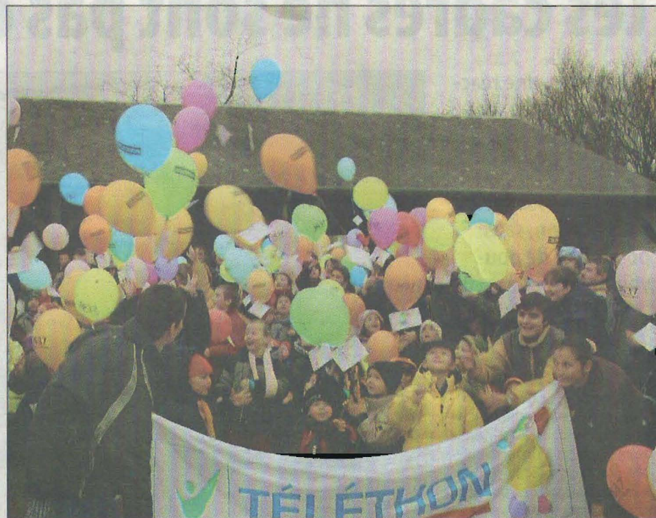
Toutes les communes (ici celle d'Amilly, en 2002) peuvent participer au Téléthon, en organisant un défi important ou un simple lâcher de ballons, rempli d'espoir pour les enfants (archives).

La liste n'est pas exhaustive au regard du nombre de manifestations et de participants, dont plusieurs établissements scolaires. À Thivars, des artisans d'une société d'Ézy-sur-Eure, construiront le vendredi 5, pendant 30 heures, une salle de